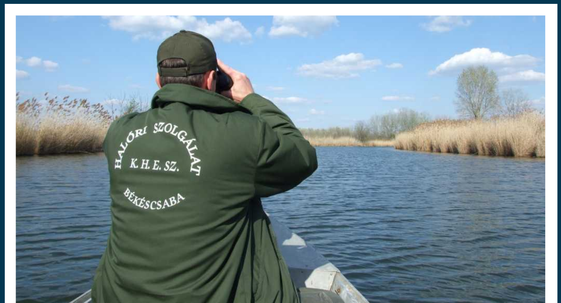
Halór ellenőrző körúton.