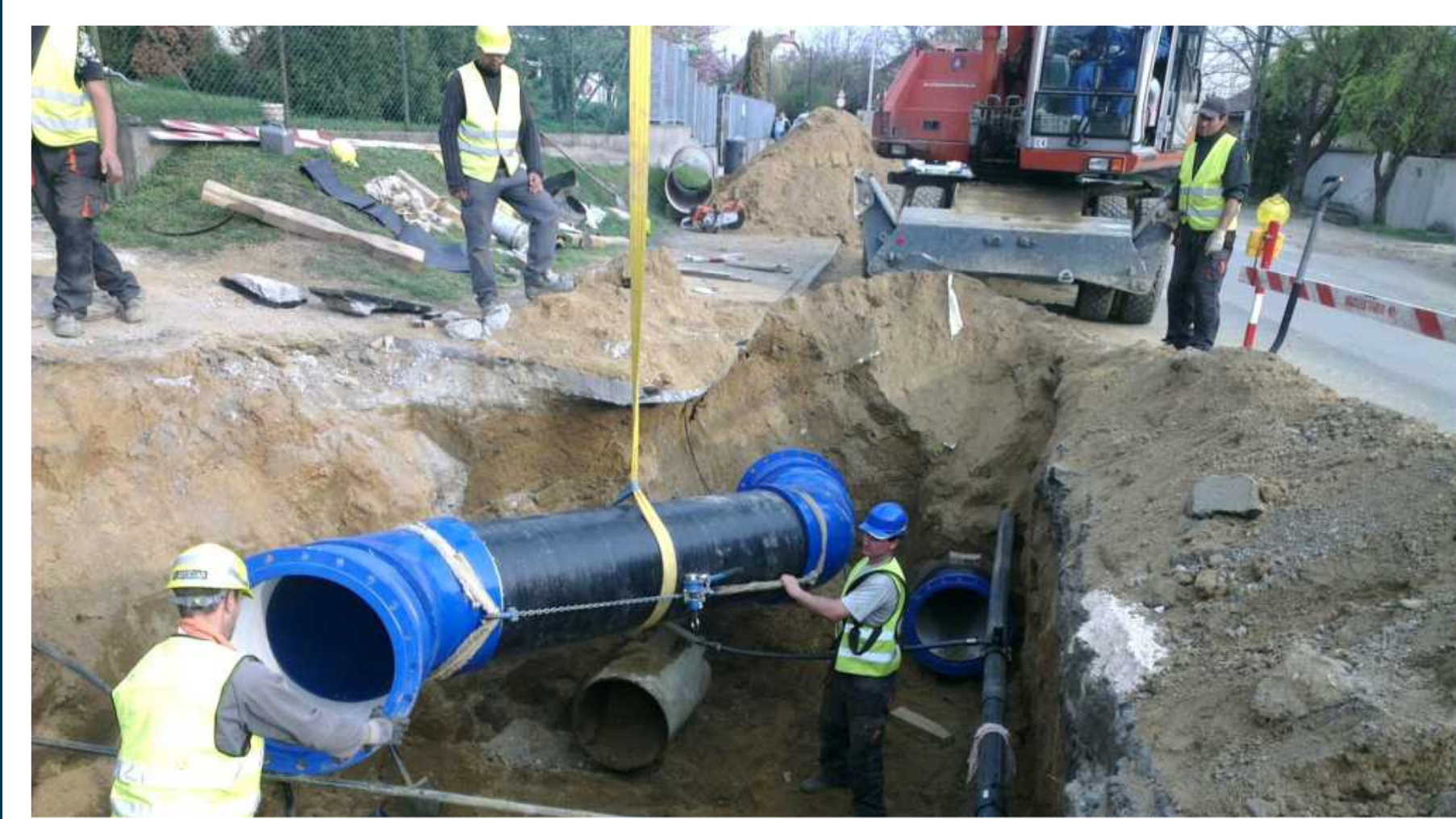
Ivóvízhálózat rekonstrukció, szerelési munkák.