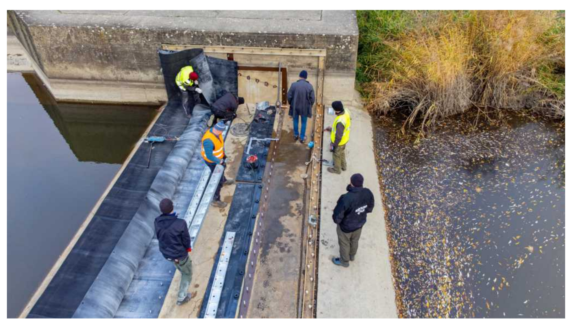
Duzzasztómű rekonstrukció, szerelési munkák.

A fizikai igénybevétel és időjárás kitétségek miatt, ma is vannak foglalkozási körök, amelyeket többnyire férfiak gyakorolnak: szivattyútelepi gépész, gázsedő, gépkezelő, gépszerelő, karbantartó, kútfúró, halór, stb.