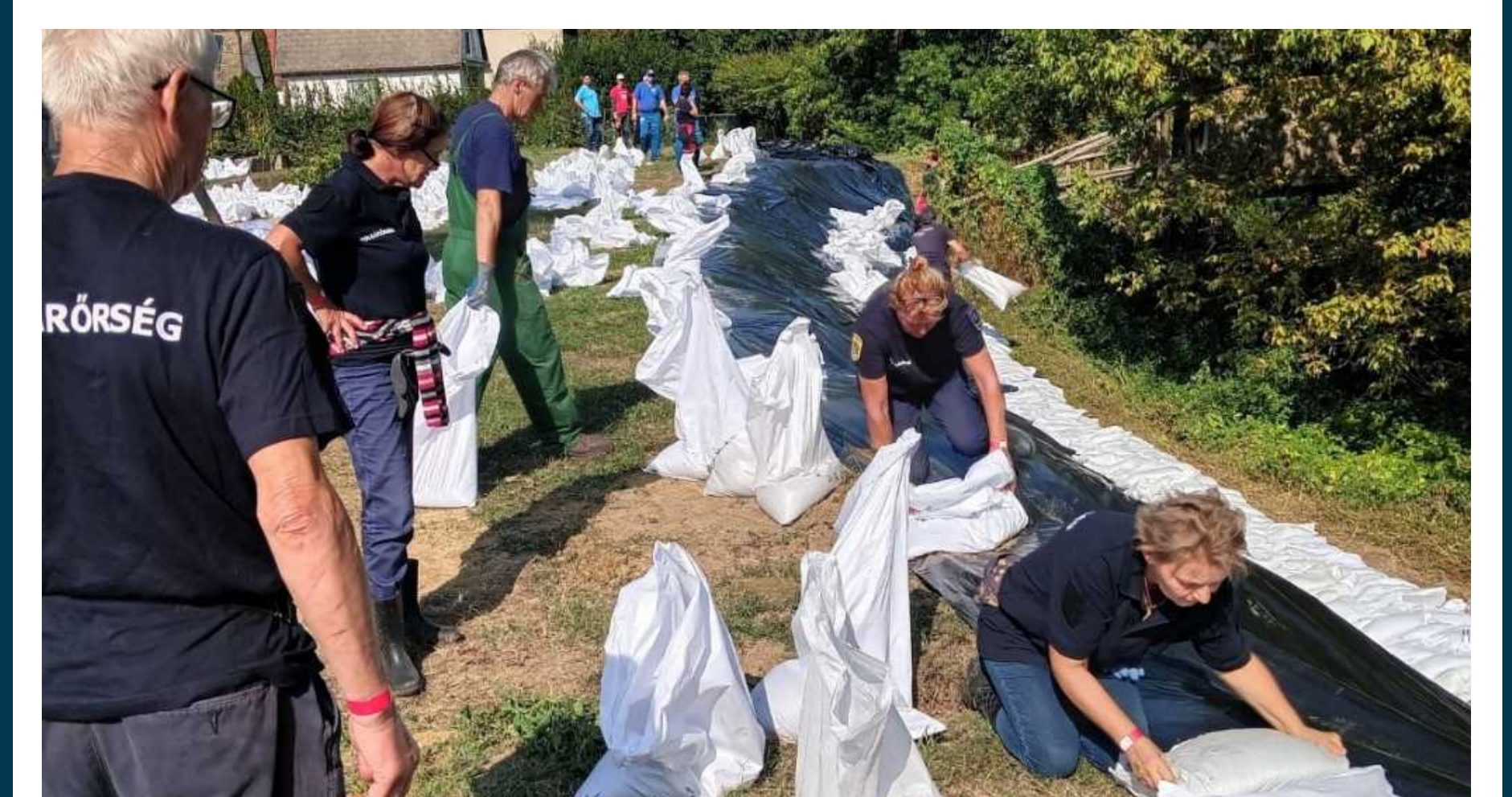
Árvízvédekezés belterületen, nyúlgátépítés.