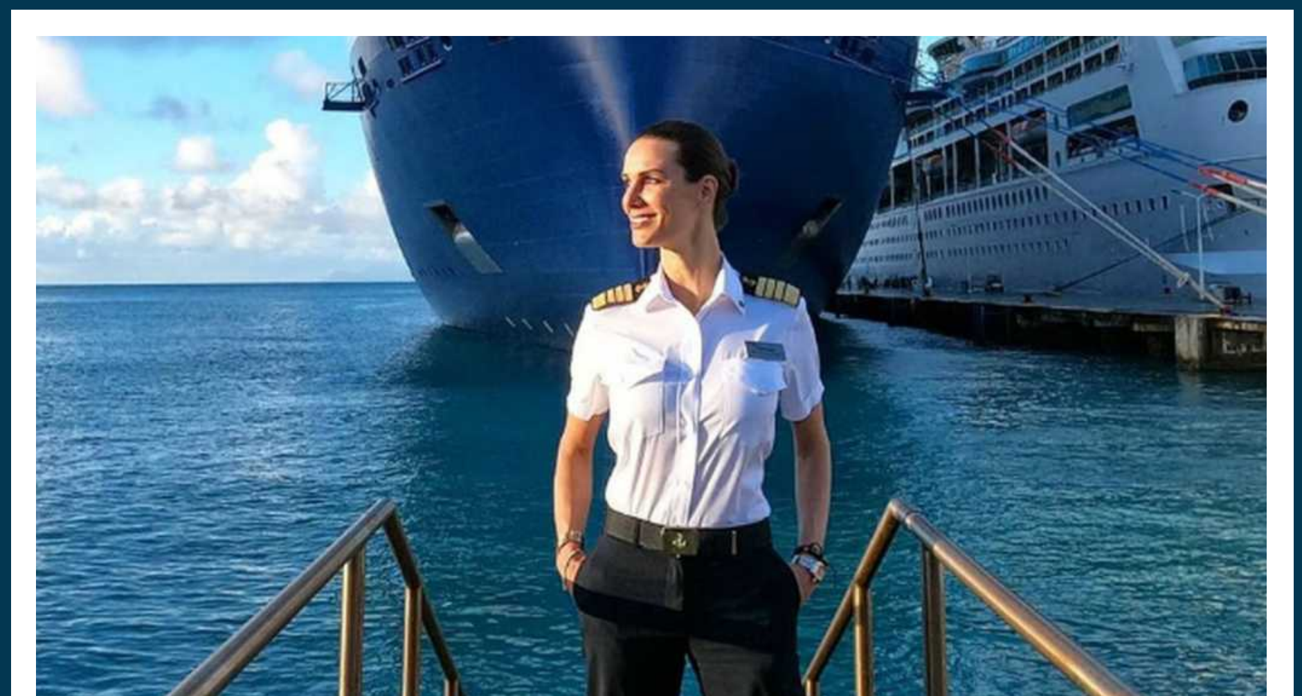
Az első női kapitány, aki nagy méretű tengerjáró hajót irányított (USA 2015).

Magyarországon a víz rendelkezésre állása napjainkban kedvező feltételeket biztosít a nők számára az esélyegyenlőség megteremtéséhez, de ez a folyamat nem terjed ki a társadalom egészére. A vízszegénység Magyarországon is létező társadalmi és infrastrukturális probléma, amely 2024-es adatok szerint, több mint 200 000 embert érint. A vízszegénység nem pusztán vízhiányt jelent, hanem a hozzáférést a biztonságos, tiszta és megfizethető ivóvízhez.