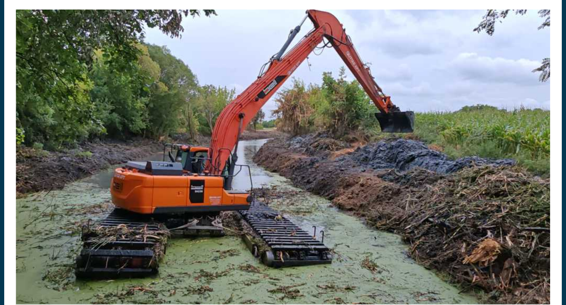
Belvizes csatorna, fenntartási munka.